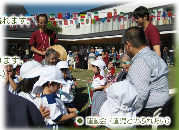
● 運動会 (園児とのふれあい)

各種ボランティアによる活動があります。 (傾聴ボランティア、お神輿、漫才、演奏会等)