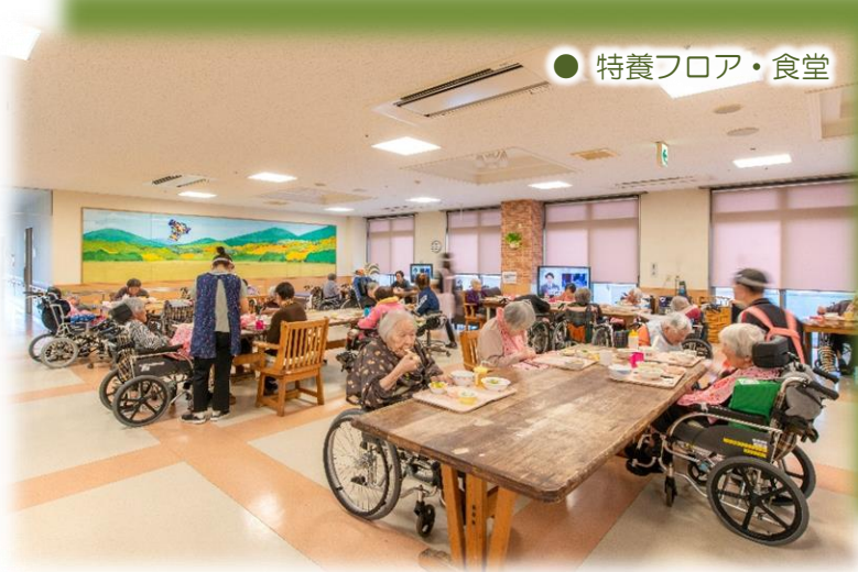
● 特養フロア・食堂

元気な毎日を送れる は「自立支援介護」 水分・食事・排泄・ を行い、残存能力の 者様一人ひとりの自 ています。