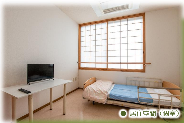
● 居住空間 (個室)