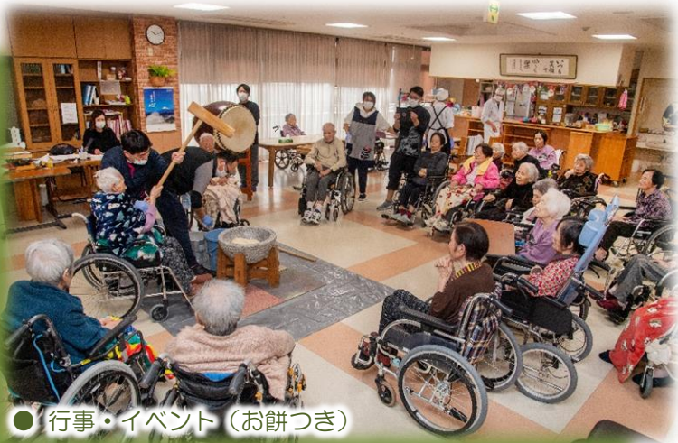
● 行事・イベント (お餅つき)

元気な毎日を送れる は「自立支援介護」 水分・食事・排泄・ を行い、残存能力の 者様一人ひとりの自 ています。