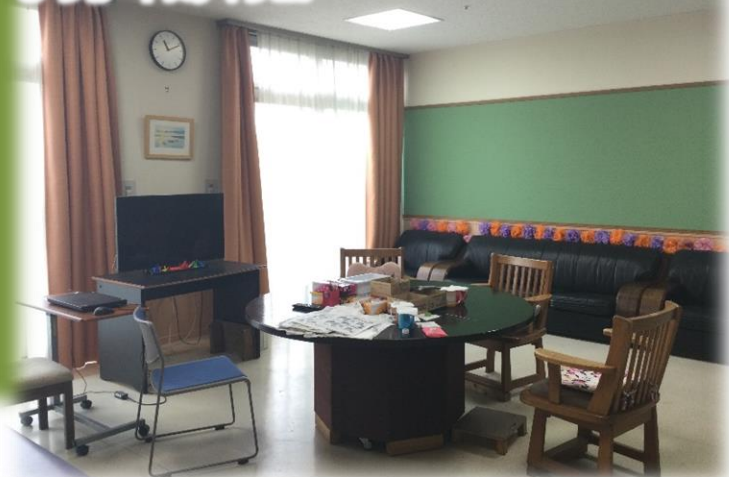
● ショートステイフロア